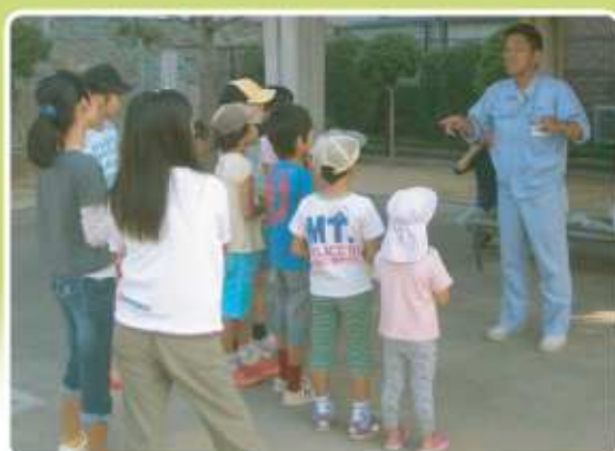
緑についてのお話

子ども会や敬人会、自治会などで行う愛護活動に 公園の利活用や樹木の大切さを皆さんにご理解していただく為、 植栽されている樹木などに樹名板を取り付けませんか？