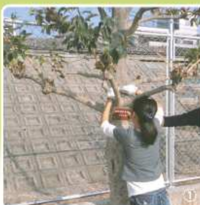
取り付け作業風景 ①ぶら下げ式 ②打ち込み式