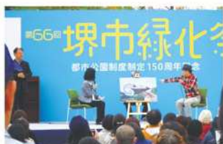
▲ 葉っぱの切り絵アーティスト リト氏トークショー