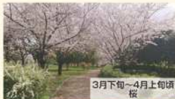
3月下旬~4月上旬頃 桜

2023年12月に、どら池南側の大芝生広場の近く(杉風舎横)にオストメイト対応の新しいトイレが完成しました。災害用の備品庫にもなっています。 利用時間: 4~9月 5:00~21:00 / 10~3月 6:00~21:00