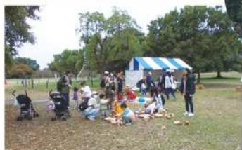
▲ キッズエリア(大芝生広場)