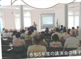
令和5年度の講演会の様子