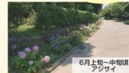
6月上旬~中旬頃 アジサイ

公園には沢山の花や木が植えられています。特に春～夏にかけては色々な花を楽しむ事ができます。