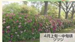
4月上旬~中旬頃 ツツジ