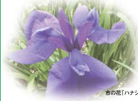
市の花「ハナショウブ」

この「荒山公園」のほかに、6つの公園と泉ヶ丘緑道の清掃を行い、美しく保つために、同校区の各町内会からボランティアとして参加しているメンバーは現在12名。現メンバーで3代目になります。