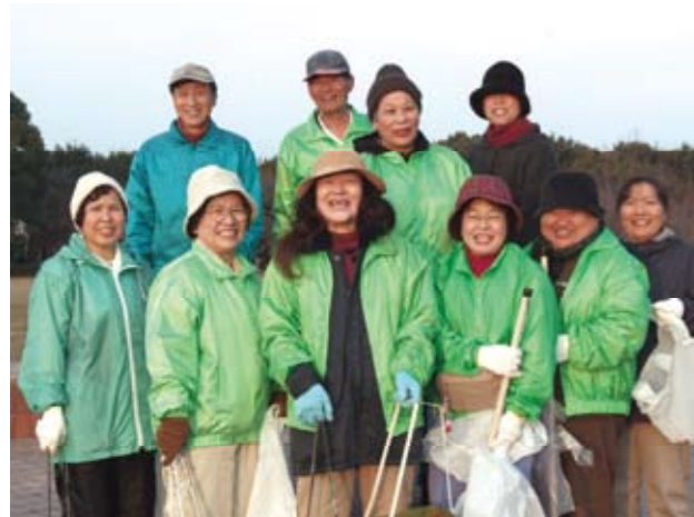
活動中も笑顔の宮山台校区のみなさん

町の誇りである公園を 美しく保ちたい 早朝から仲間が集まり、 楽しく活動しています！