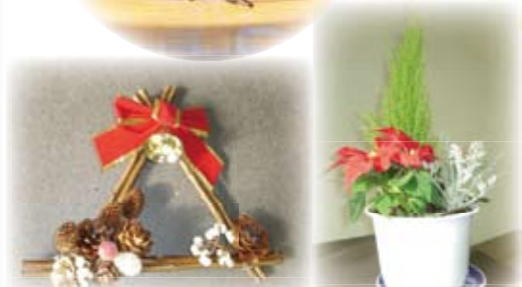
クリスマスリースづくりや寄せ植えをしました。